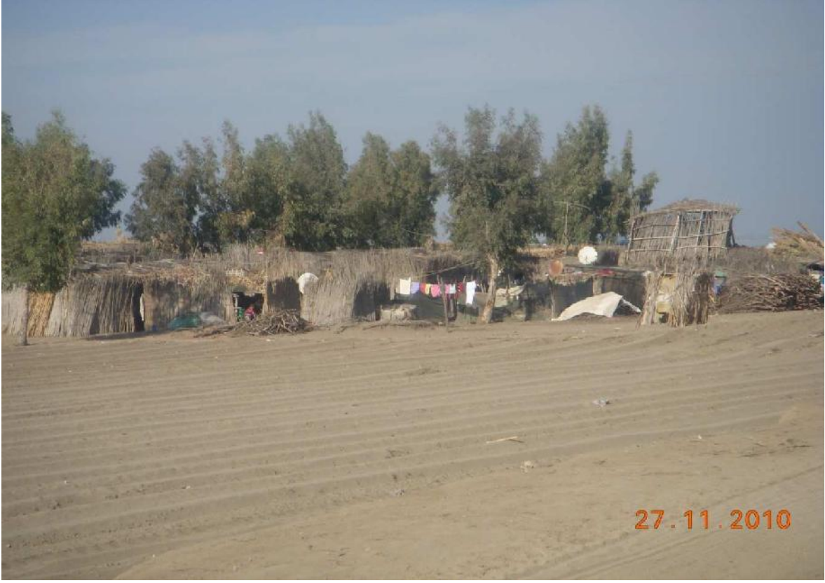
Göç Sonrası- Tuzla Beldesi, Karataş ilçesi, Adana-2010