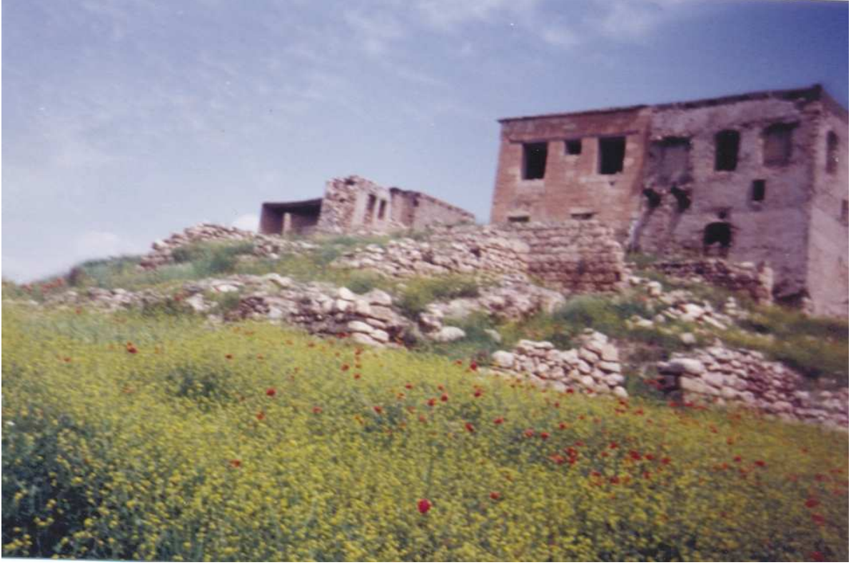
Göç Sonrası Köy-Diyarbakır