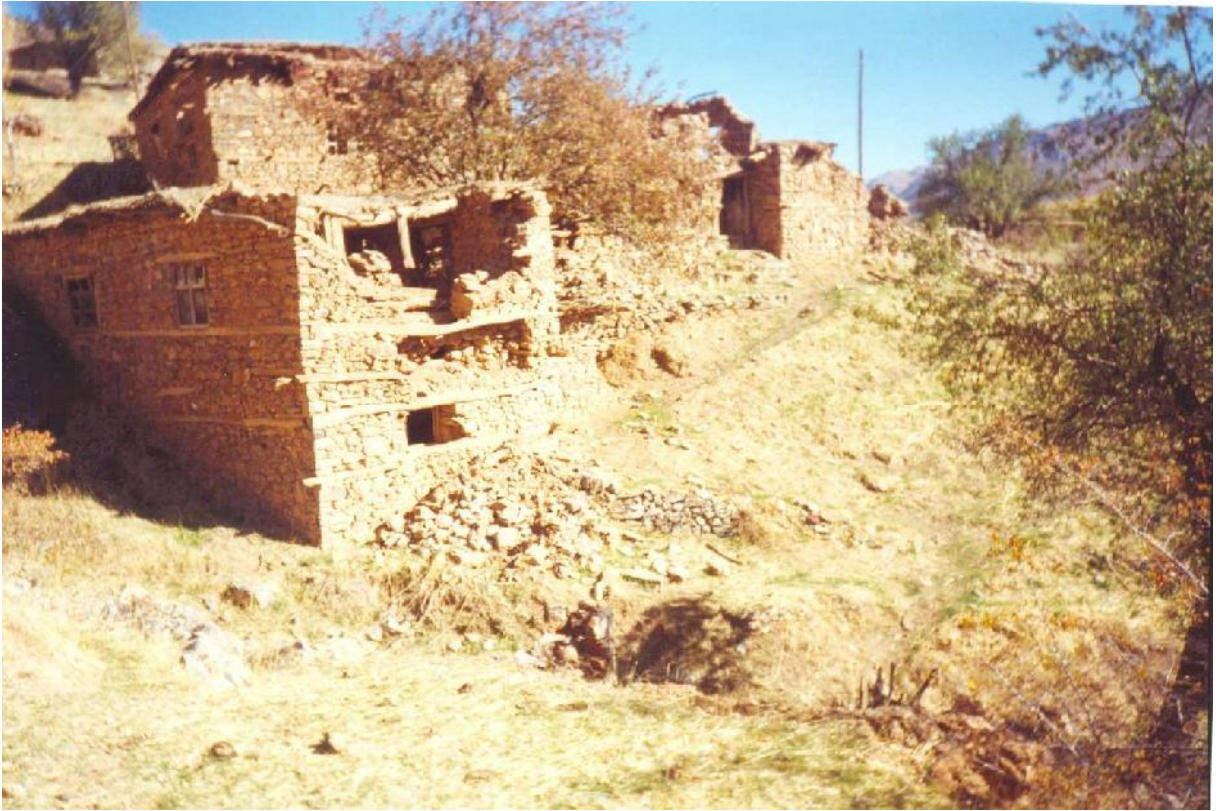
Göç Sonrası Köy-Van