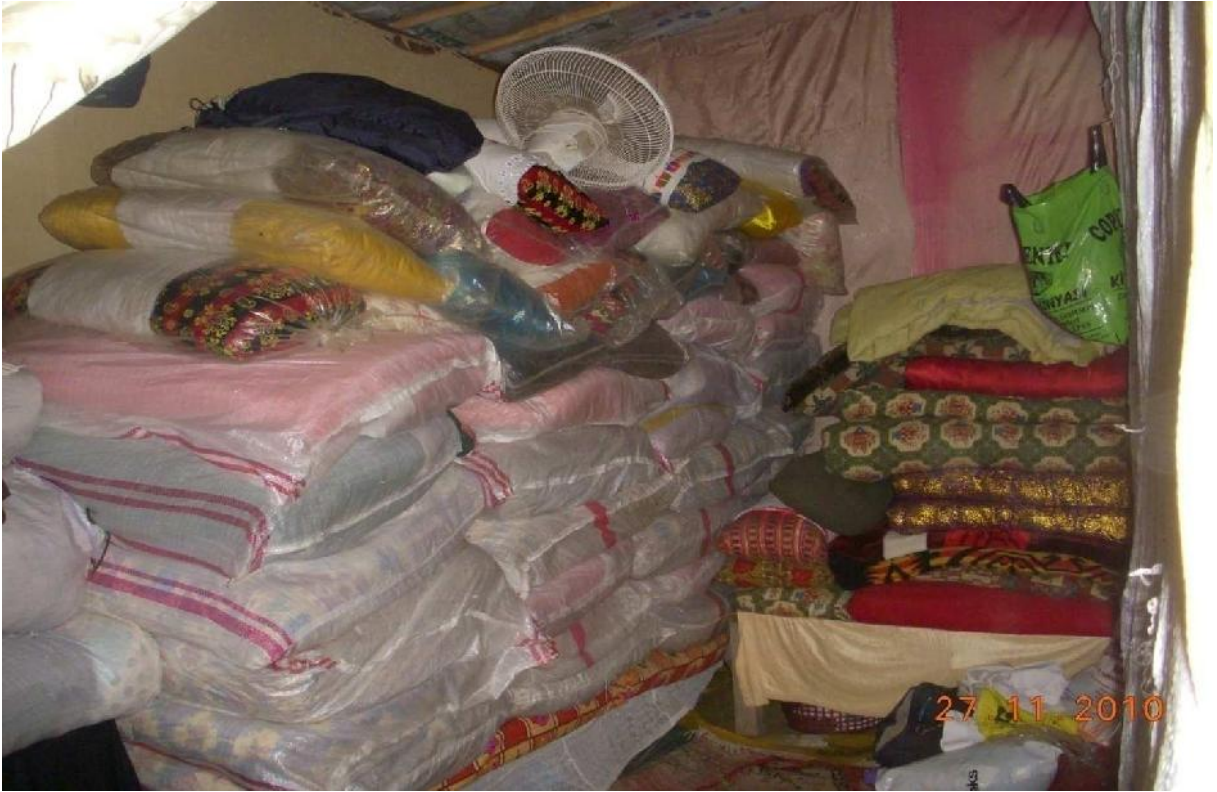
Göç Sonrası- Tuzla Beldesi, Karataş ilçesi, Adana-2010