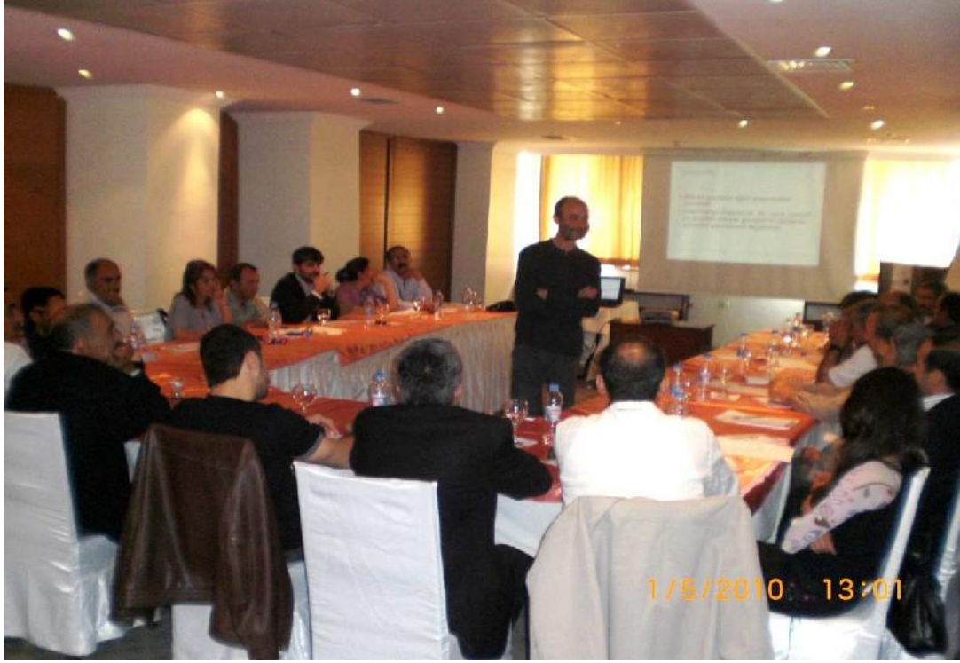
Göç Platformu IDP' lere Yönelik Sosyal Adalet Projesi "İnsan Hakları Denetimi ve Raporlamaya Yönelik" Eğitim 30 Nisan-2 Mayıs 2010/ Diyarbakır