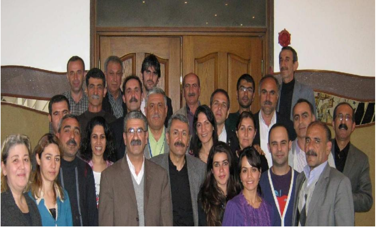
Göç Platformu Bileşenleri Temsilcileri-Mersin