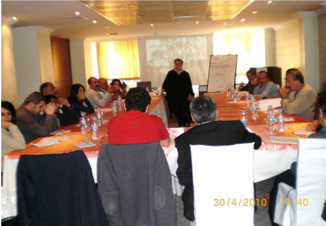
Göç Platformu IDP' lere Yönelik Sosyal Adalet Projesi "İnsan Hakları Denetimi ve Raporlamaya Yönelik" Eğitim 30 Nisan-2 Mayıs 2010/ Diyarbakır