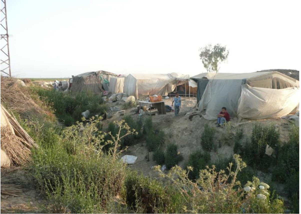
Göç Sonrası- Tuzla Beldesi, Karataş ilçesi, Adana-2010