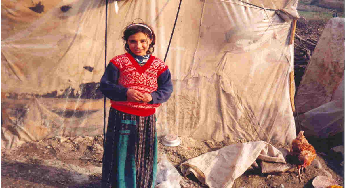
Zorunlu Göç Mağduru Çocuk...