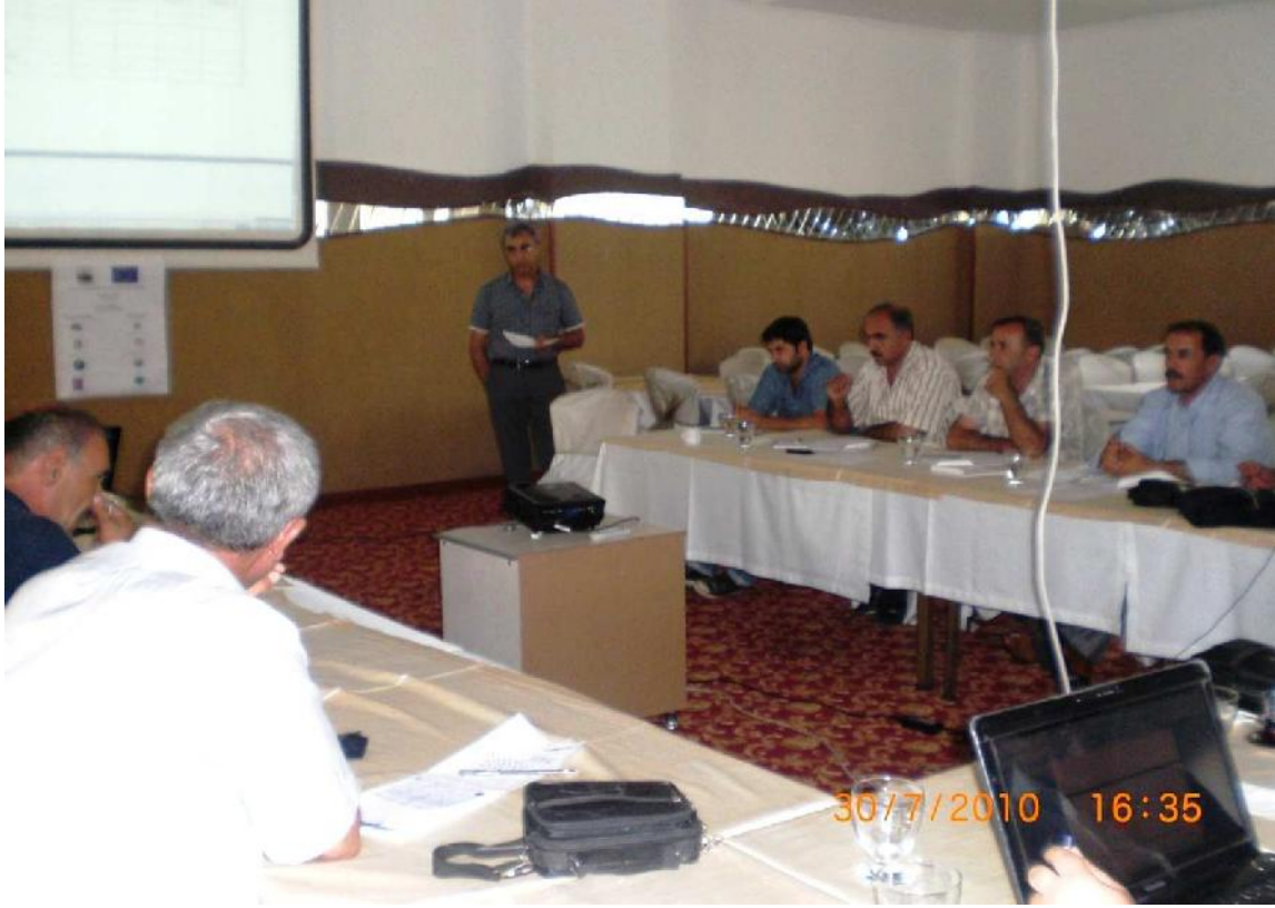
Göç Platformu IDP 'lere Yönelik Sosyal Adalet Projesi "Sosyal Haklar" Çalıştayı 30-31 Temmuz 2010/Mersin