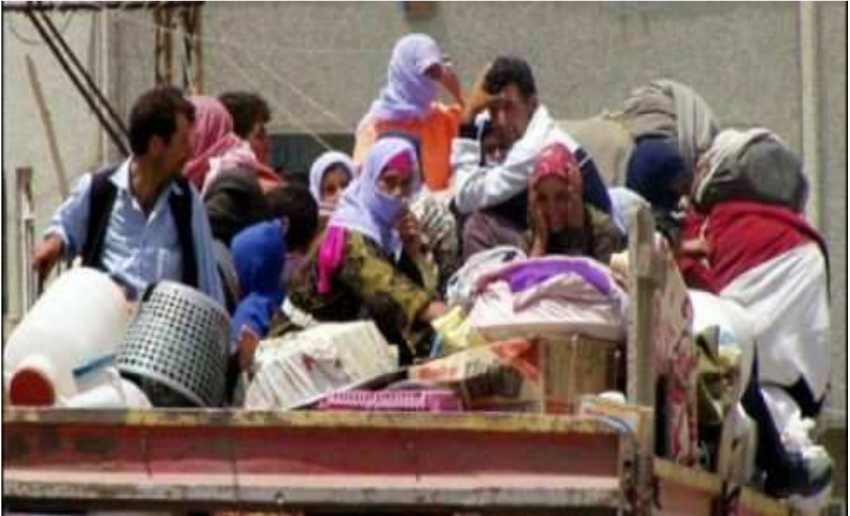
Göç Yolundaki Göçzedeler...