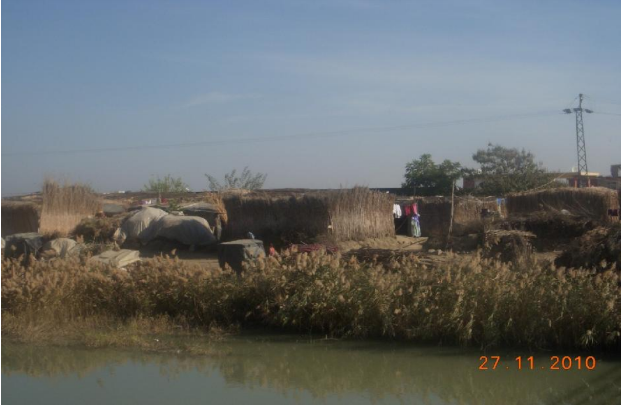
Göç Sonrası- Tuzla Beldesi, Karataş ilçesi, Adana-2010