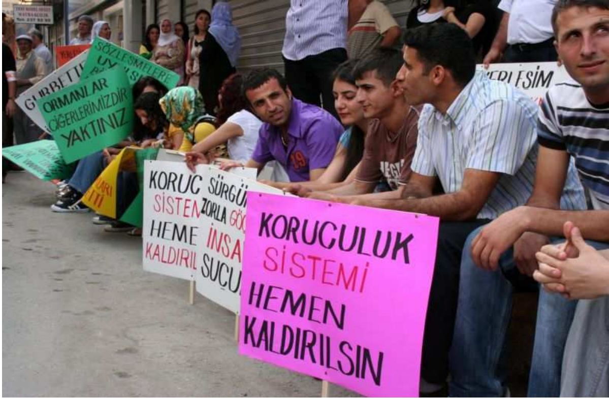
14-21 Haziran 2009 Göç Haftası Etkinlikleri/Mersin