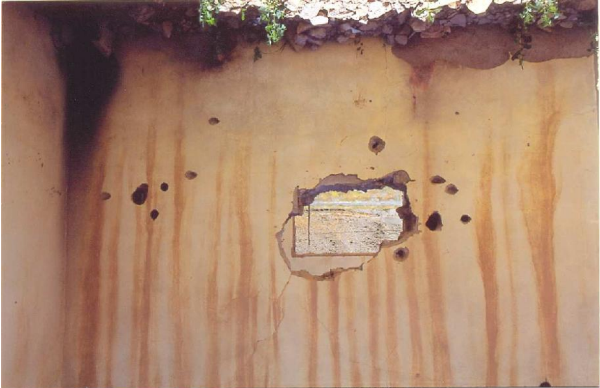
Yıkılmış ve Kurşunlanmış Ev-Diyarbakır