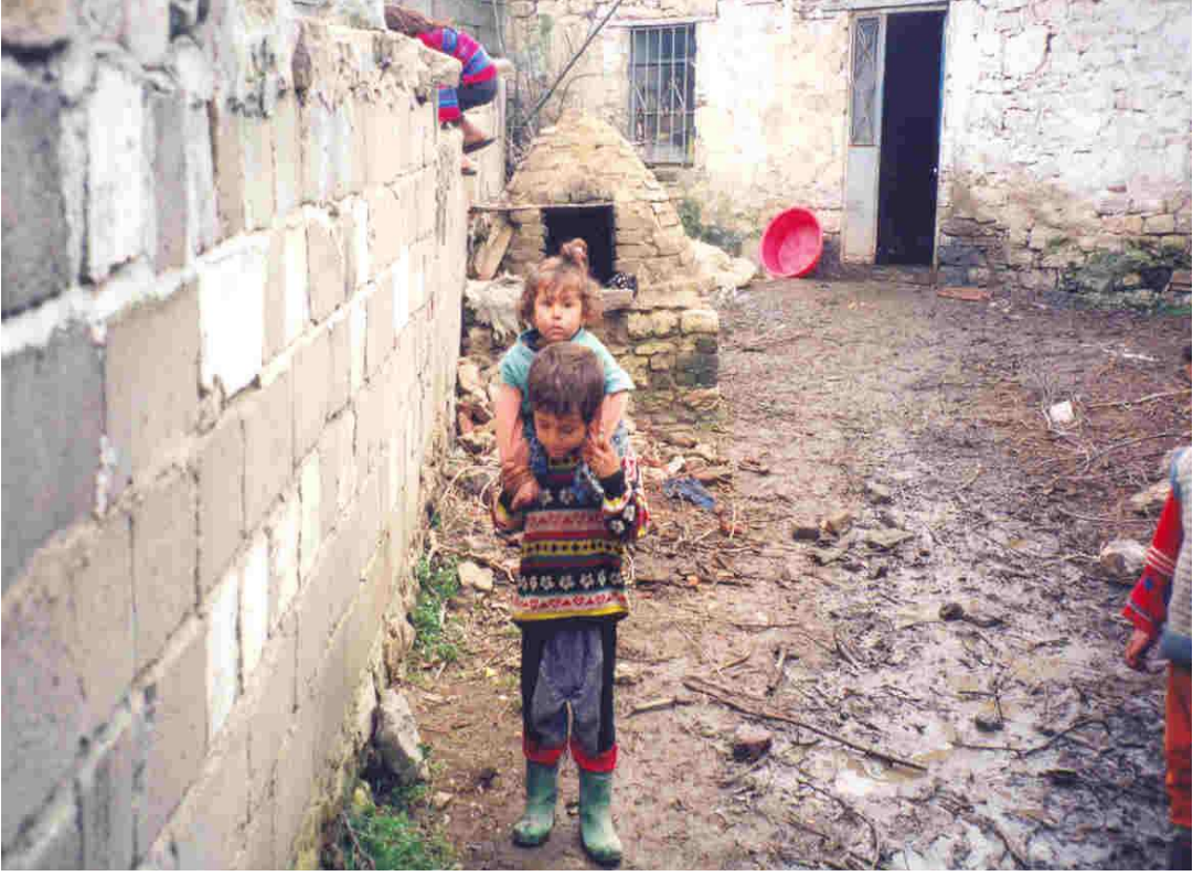
Göç Sonrası Yaşamdan Kesitler...-Batman