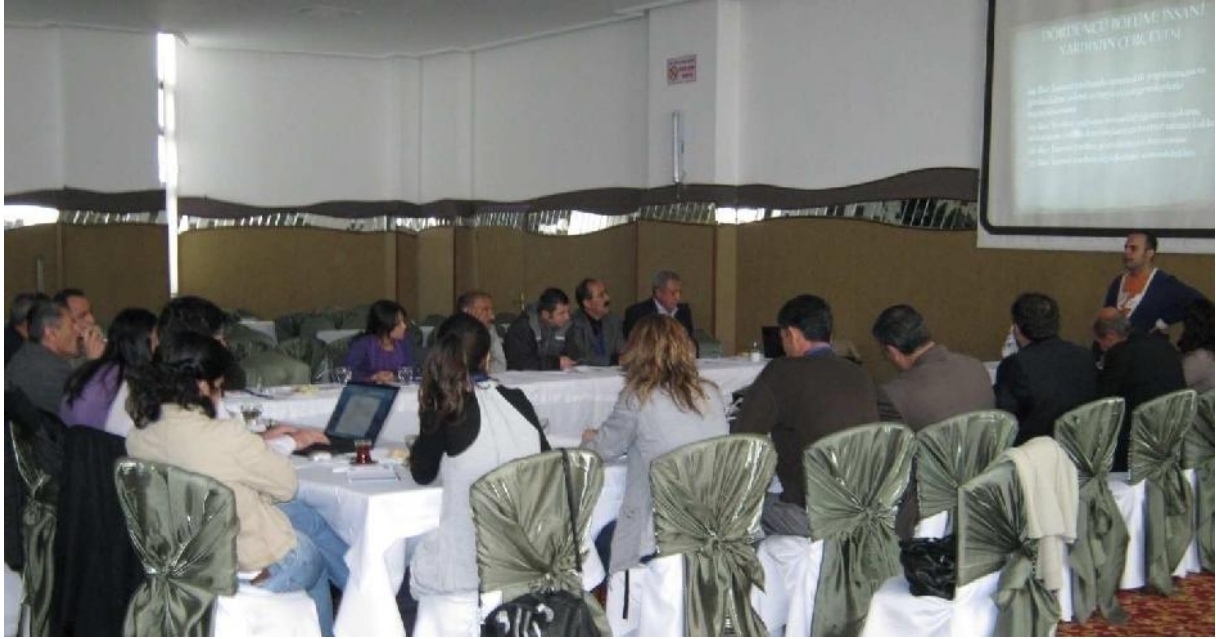
Göç Platformu IDP' lere Yönelik Sosyal Adalet Projesi "Hak Odaklı Yaklaşım Eğitim Programları ve Savunma Araçları" Eğitim 26-28 Mart 2010/ Mersin