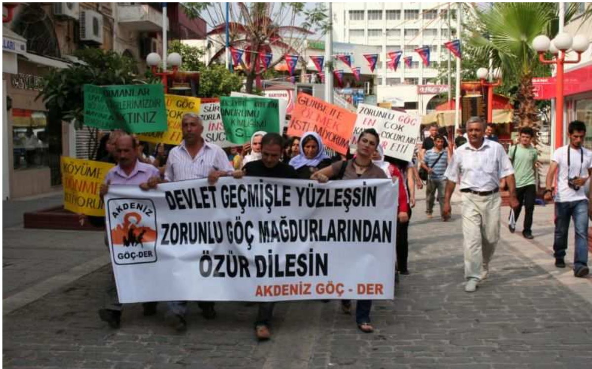
14-21 Haziran 2008 Göç Haftası Etkinlikleri/Mersin