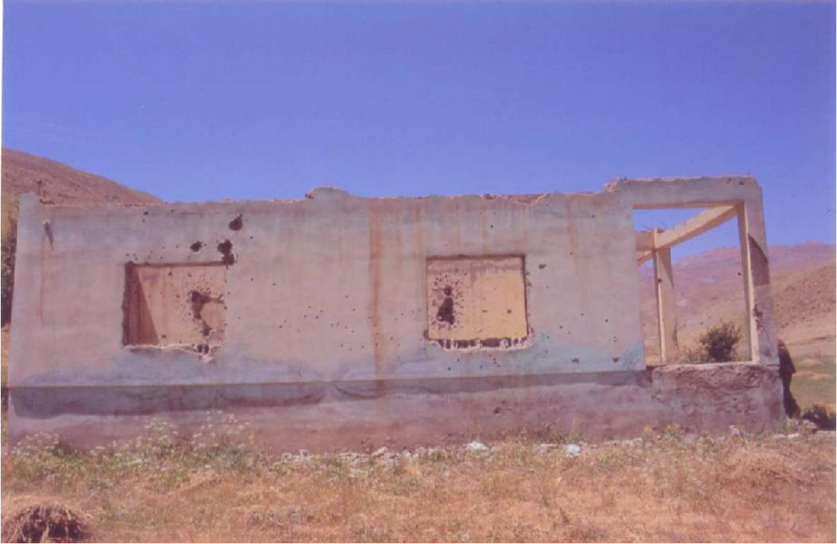
Yıkılmış ve Kurşunlanmış Ev-Diyarbakır