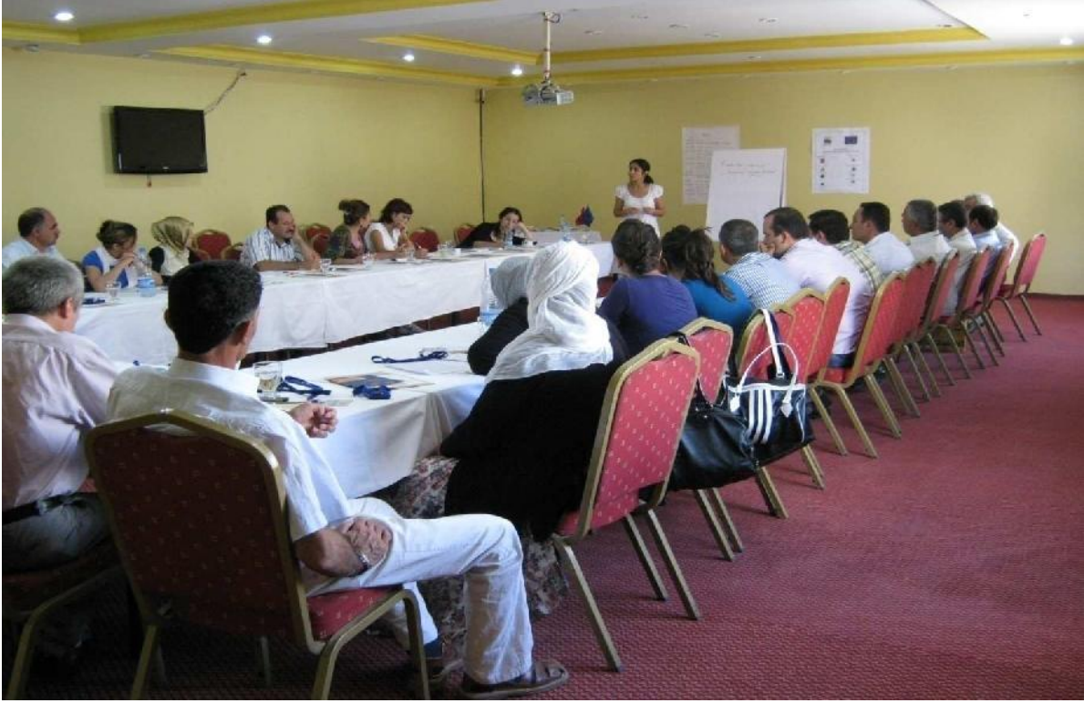
“Toplumsal Cinsiyet” ve “Proje Araştırma Yöntemi Bilgilendirme” Eğitimleri 14-15 Ağustos 2010 / Mersin 21-22 Ağustos 2010 / Van