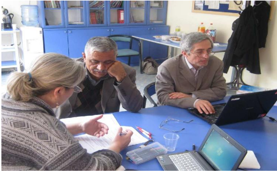
Göç Platformu IDP 'lere Yönelik Sosyal Adalet Projesi "Kampanya Çalıştayı" 23 Nisan 2011/Mersin