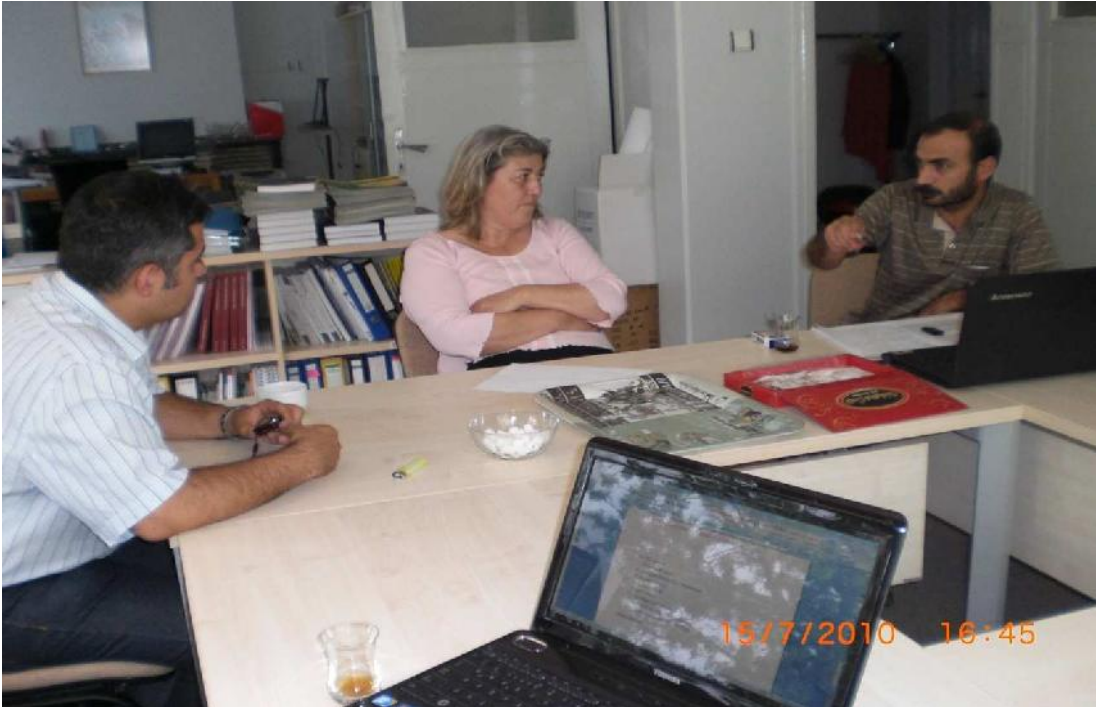
5233 Sayılı Yasa Kapsamında, Anket Sorularının Hazırlanması Toplantısı 15 Temmuz 2010 Ankara-IHOP Ofisi