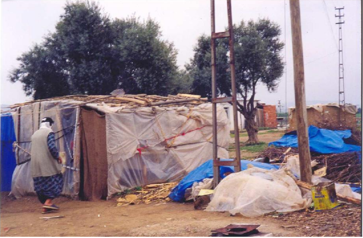
Göç Sonrası- Mersin