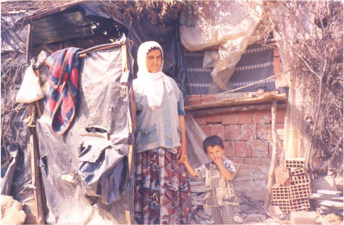
Göç Sonrası- Mersin