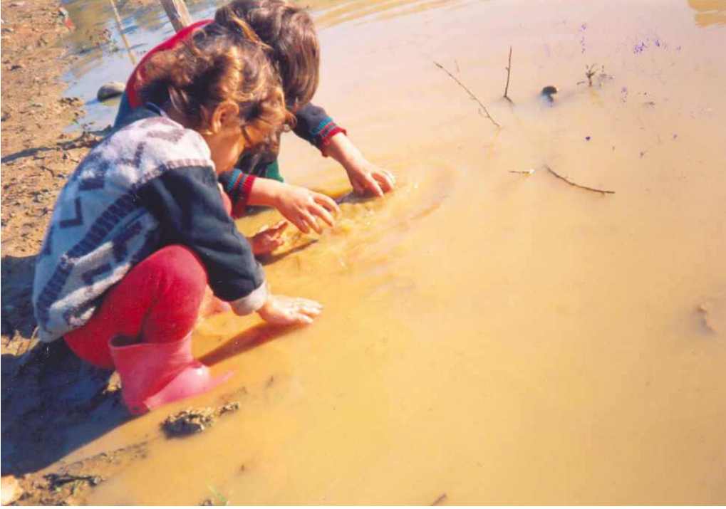
Göç Sonrasında Çocuklar...