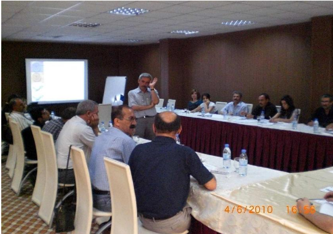
Göç Platformu IDP 'lere Yönelik Sosyal Adalet Projesi "İnsan Hakları Denetimi ve Belgelendirme Eğitimi" Göç Platformu Stratejik Plan Çalıştayı 4-6 Haziran 2010/Batman